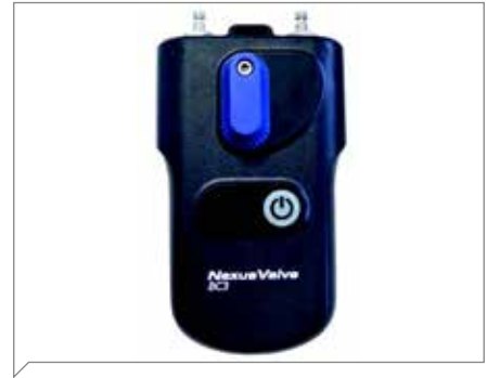
Nexus BC 3