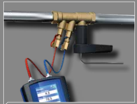
Tarkka ja helppo säädettävyys