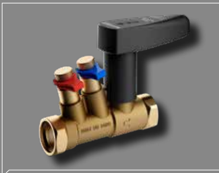
Säätö- ja sulkuventtiili + virtauksen mittaus

Nexus - säästöä asennus- ja energiakuluissa. Tarkkaan säätämiseen.