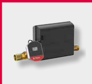
Flexcon PA jednotka automatického doplňování