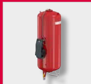
Flexcon MK-U expanzní automat *