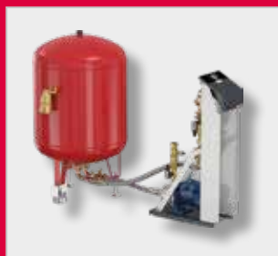
Flamcomat G4 Starter expanzní automat