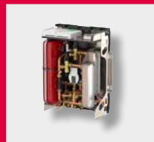
LogoEco Dual G2 bytová stanice