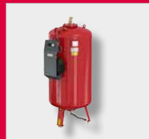
Flamcomat MK-U G4 expanzní automat