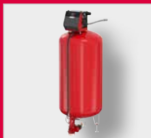
Flamcomat G4 MK-C expanzní automat