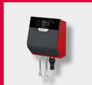
FlexFiller Direct G4 jednotka automatického doplňování