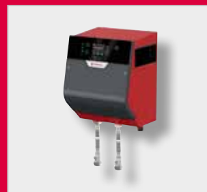
FlexFiller Mini jednotka automatického doplňování