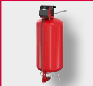
Flamcomat G4 MK-C Autómata de expansión