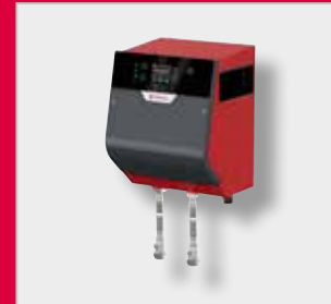
FlexFiller Mini Unidad de presurización