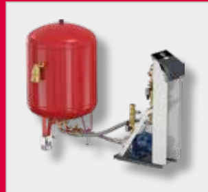
Autómata de expansión de arranque Flamcomat G4