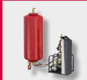
Flamcomat MP G4 Autómata de expansión