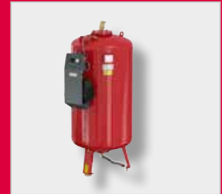
Flamcomat MK-U G4 Autómata de expansión