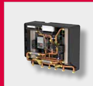
LogotipoEco G2 Unidad de interfaz de calor