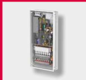
LogotipoMatic G2 Unidad de interfaz de calor