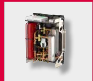
LogotipoEco Dual G2 Unidad de interfaz de calor