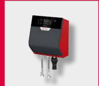
Unidad de presurización FlexFiller Direct G4