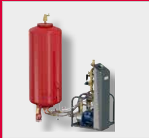
Flamcomat G3 Autómata de expansión *