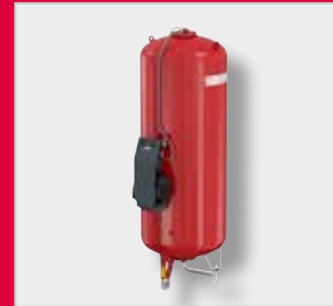
Flexcon MK-U Autómata de expansión *