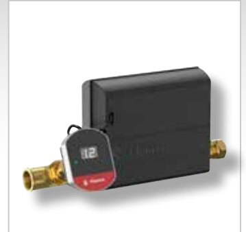
Flexcon PA AutoFill Drukbehoudassistent