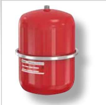
Flexcon Premium Expansievaten

handigde montagehulpmiddelen als de FlexConsole en T-plus. Onze producten zijn uiterst duurzaam, energiezuinig en hebben een lange levensduur.