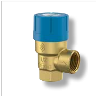
Prescor Veiligheidsventielen (Drinkwater)