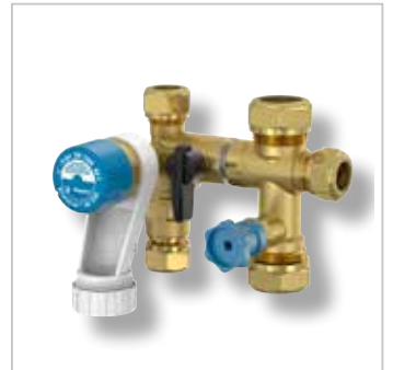
Prescor IC Fill Veiligheidsgroep