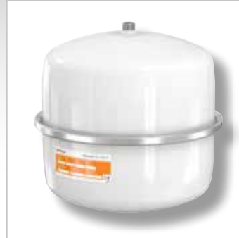
Flexcon Solar Expansievaten