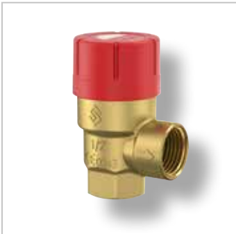
Prescor Veiligheidsventielen (Verwarming)