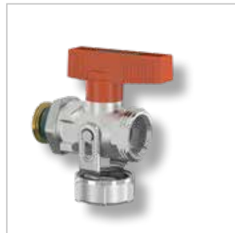
Simplex KFE Kogelkranen (Solar)