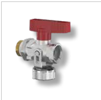
Simplex KFE Kogelkranen (Verwarming)