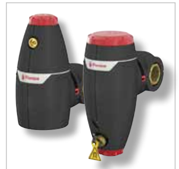
XStream Lucht- en Vuilafscidders