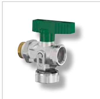
Simplex KFE Kogelkranen (Drinkwater)