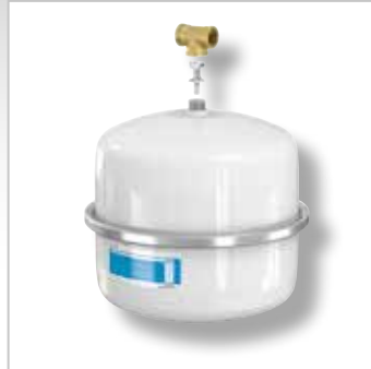
Airix Expansievaten voor drinkwater