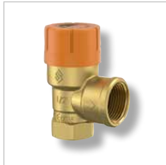
Prescor Solar Veiligheidsventielen