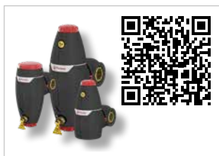
XStream Luftavskiljare och mutsavskiljare

smutsavskiljare samt produkter för mekaniskt avlägsnande av gaser med Vacumat Eco vakuumavgasare