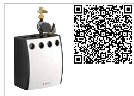
MeiFlow Shunt UD Shuntgrupp

SideFlow Clean Allt-i-ett sidoströmfilter för slutna värme och kylsystem