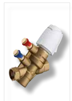
NexusValve Vivax - Tryck-oberoende styrventil (beställs separat)