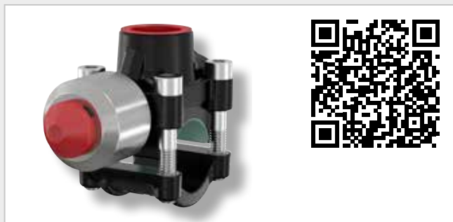
T-plus Pipe Rör förgrening

förkortar installationstiden avsevärt och förbättrar flödet genom SideFlow Clean.