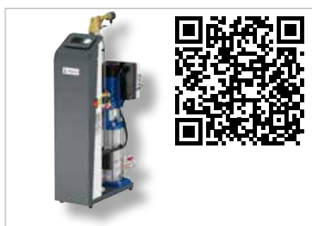
Vacumat Eco Avgasning och påfyllningsautomater