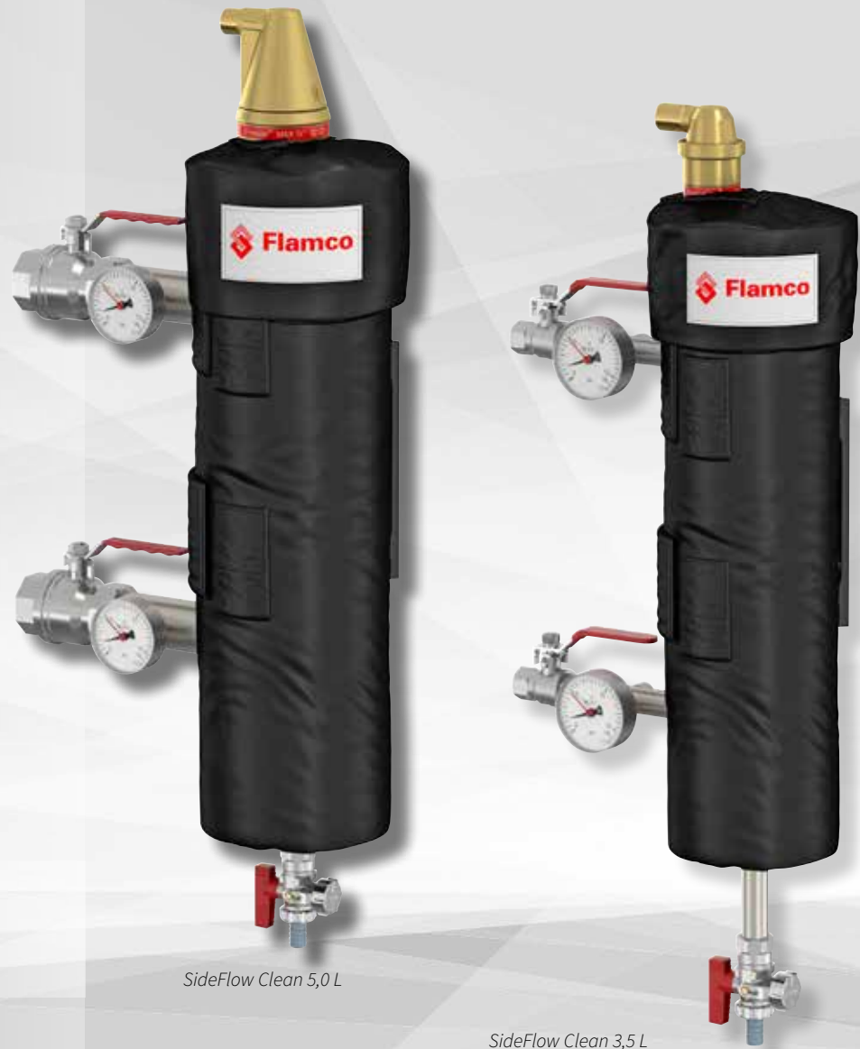
SideFlow Clean 5,0 L