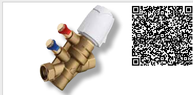
NexusValve Vivax PICV - Tryckberoende styrventil